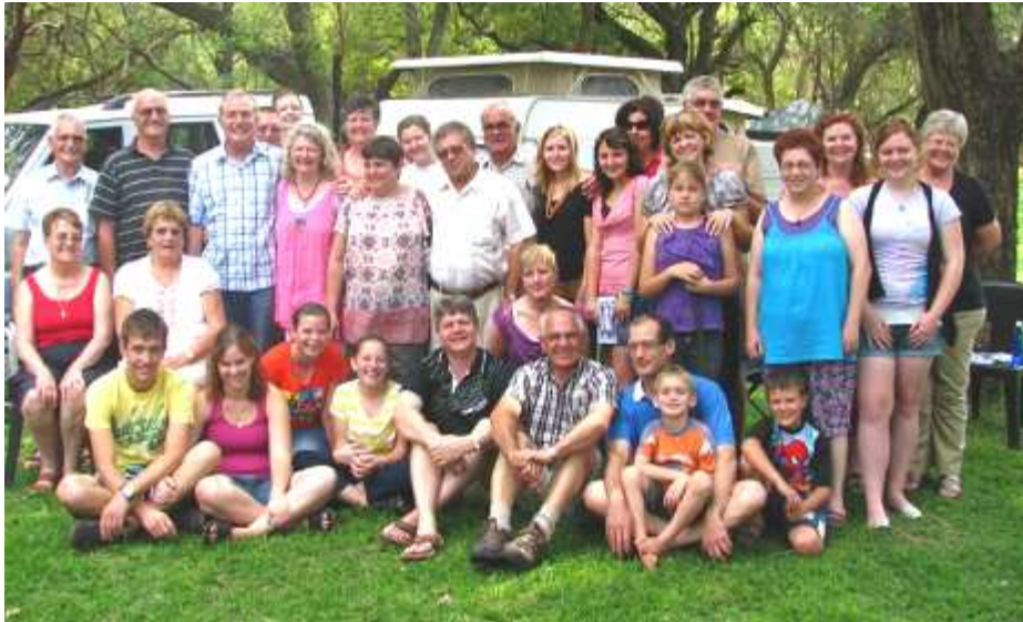
Al die gemeentekampers