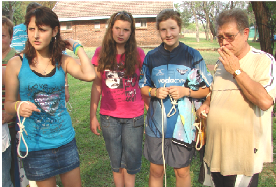
Oud en jonk en het deel geneem aan al die aktiwiteite