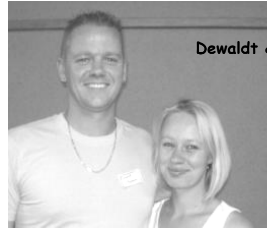
Dewaldt & Marina Slippers