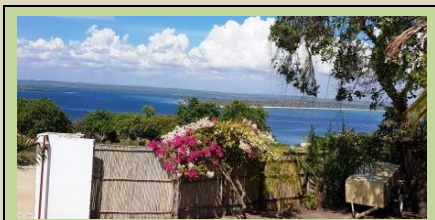
Stoep-uitsig oor Nacala baai

Dis 'n stad met 'n mengelmoes van mense – die meeste in duisternis, sonder die Lig van die Evangelie.