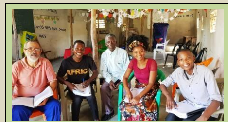
Vier van die groep van 11 deelnemers word as fasiliteerders in Pemba opgelei.