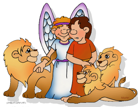
Prentjie No. 1

Kom ons kyk of julle die stories ook kan vertel - vra Pappa of Mamma of jou ouer boetie of sussie om te help as jy vashaak.