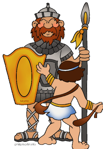
Prentjie No. 2